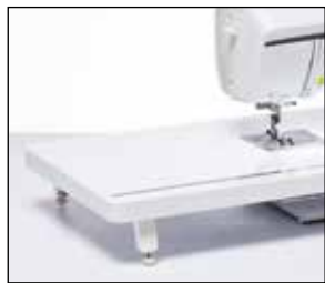
Table d'extension extra-large

Agrandissez votre plan de travail avec cette table d'extension extra-large. Idéale pour les ouvrages de quilting et de couture de grande taille. La table dispose d'une règle et d'un espace de rangement pour votre genouillère.